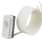
LRM8119/00 Lum Based Ext Sensor with LCA8004/00 COVER